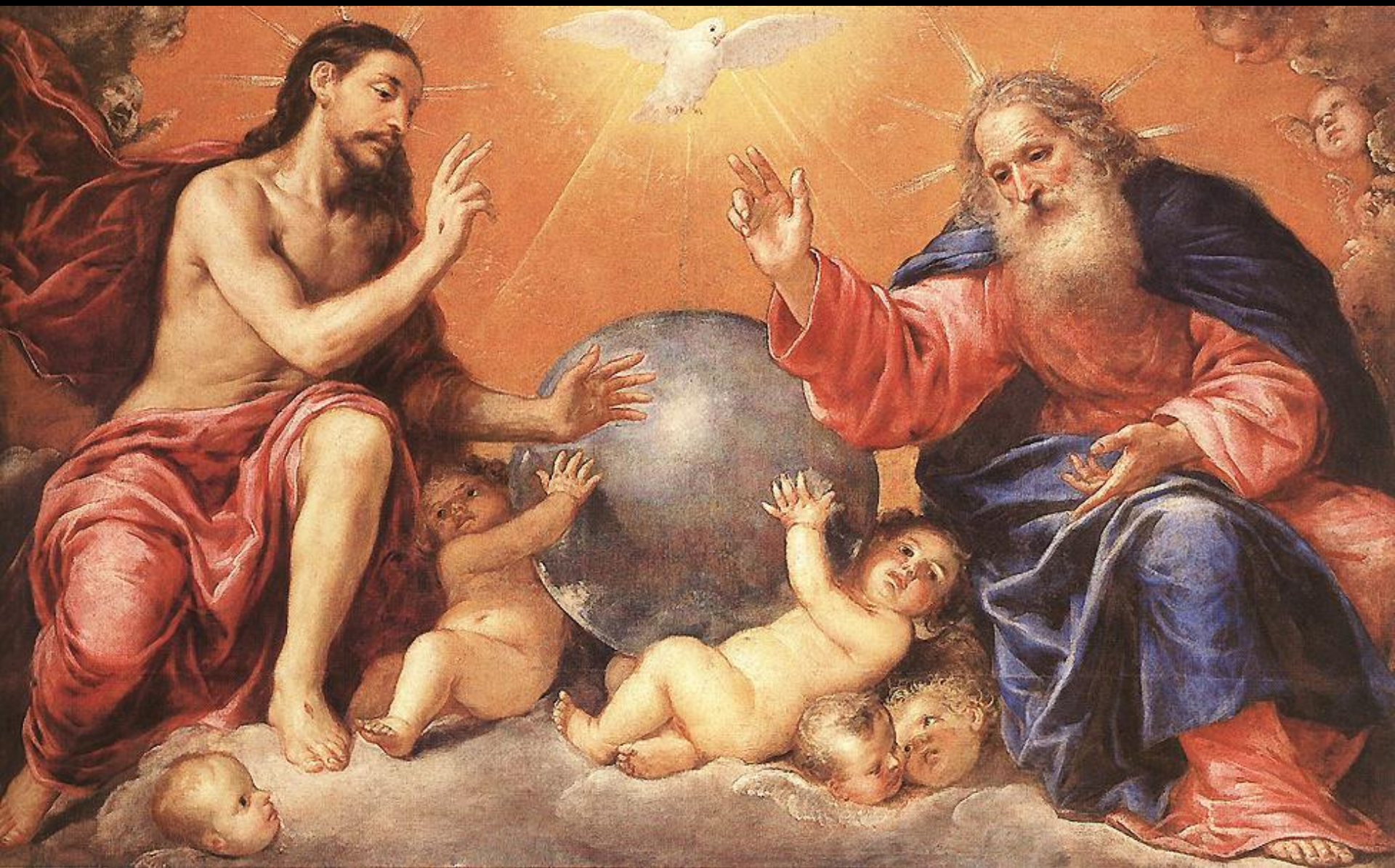
PYHÄ KOLMINAISUUS, Antonio de Pereda, 1640-luvulla