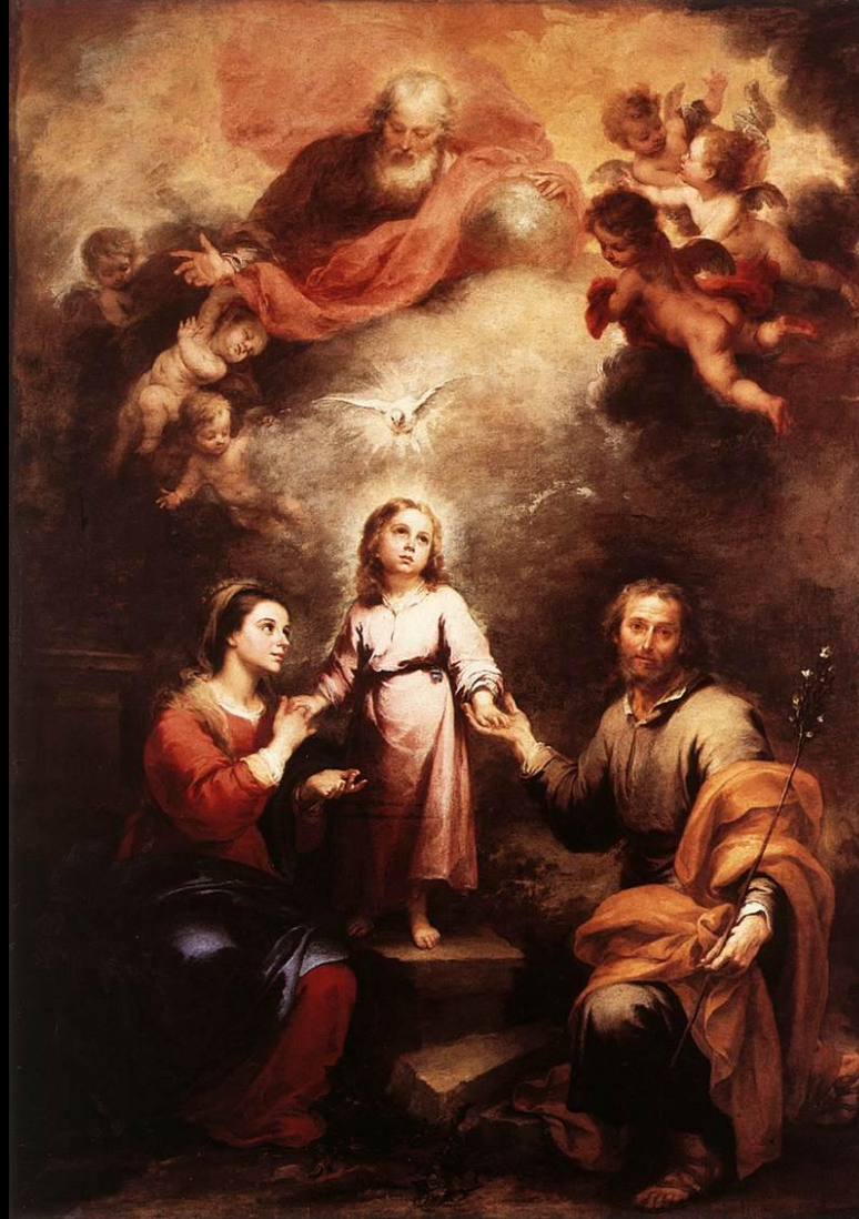
Kaksi kolminaisuutta, Bartolomé Esteban Murillo, 1675-1682