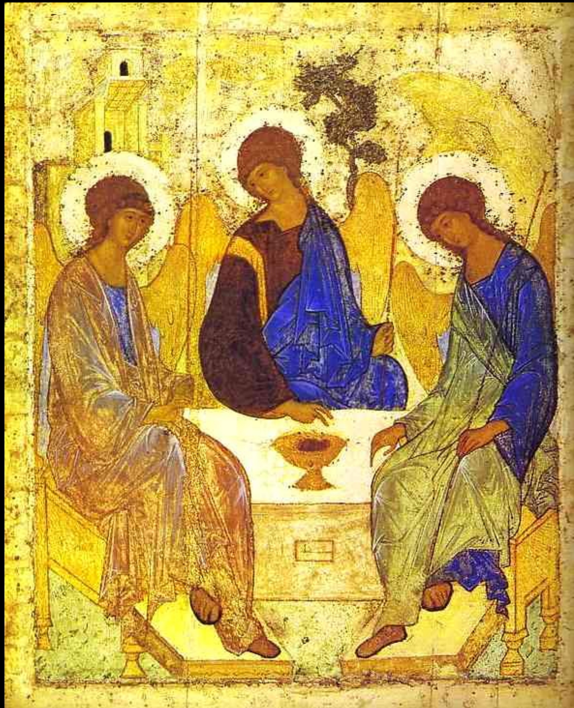
Pyhä Kolminaisuus, Andrei Rublev, v.1411